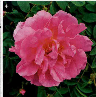
1. Il giardino nato all'interno del carcere di Bergamo. 2. Uno scorcio della tenuta presidenziale di Castelporziano (Roma). 3. La mappa del parco del Castello di Cordovado (Pordenone): a destra, a forma di sole, il nuovo labirinto di rose damascene (nella foto 4 un primo piano).